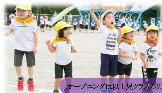
オープニングは以上児クラスのリズムから始まりました！