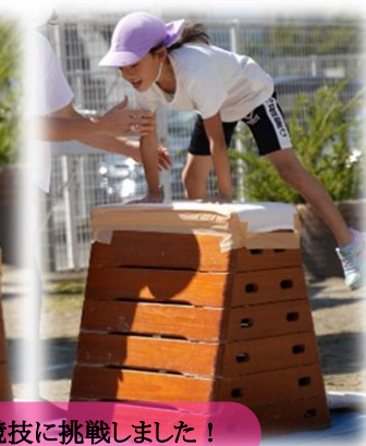
いろんな競技に挑戦しました！