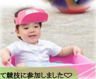
かわいい姿に変身して競技に参加しました♡